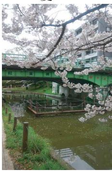
4/4 大横川親水公園 紅葉橋を撮影

報告事項として、平成二十五年度以降融資の実績がない、区小規模企業特別融資の廃止や東京における都市計画道路の整備方針(第四次事業化計画)概要などが説明されました。 ・ 平成28年度当初予算の中で都市整備部所管の予算の中に、下の写真にあり ます、大横川親水公園紅葉橋の塗装工事が計画されています。夏以降の予定だそうです。