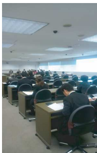
3/22 福祉保健委員会 傍聴

三月二十二日、福祉保健委員会を傍聴しました。付託された議案は四議案です。 ・ 墨田区女性福祉資金貸付条例の一部改正：専修学校の一般課程に修学する期間中月額を46500円から48000円に改正。借受者の償還期日までに支払わなかったときの元利金の延滞利息を107.5%から5%に改正。 ・ 墨田区介護保険条例の一部改正：減免申請の申請期が今月から減免を受けようとする月の末日までに延長されます。