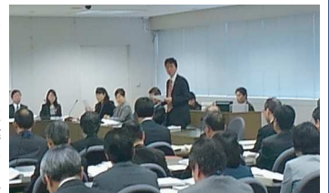
3/24 企画総務委員会 質疑

三月二十四日、企画総務委員会が開かれ質疑しました。 ・ 墨田区職員定数条例の一部改正：4月1日より定数を区長等の事務職員1844人、幼稚園の園長及び職員211人で合計1865人となりました。 ・ 職員の退職管理に関する条例(区独自条例)：①再就職者のうち、地方公務員法で規定されている条例部長を除く管理職(校長・副校長等含む)であった者について、退職後二年間は、退職前五年より前の期間において当該職に就いていたときの職務に属する契約事務に関する働きかけの禁止。②管理職(校長・副校長等含む)であった者が、営利企業に再就職した場合に、退職後二年間、人事委員会規則で定める事項を任命権者に届け出ること義務づけ。 本年4月1日以後に退職した職員について適用されます。 ・ 報告事項：大学誘致の進捗状況について ・ 墨田区広報広聴戦略プランについて：今のマスコミなどはワンフレーズでインパクトを与える場合が多いので、墨田区も例として小江戸「川越」や小京都「」のようなワンフレーズが必要であると区長及び理事者に質問しました。 ・ 建設工事の発注に係る総合評価競争入札方式の本格実施 ・ 墨田区人権啓発基本計画(中間見直し)について ・ 新会計制度の整備について：会計ソフトにおいて、現在墨田区のパソコンのOSはウィンドウズだが、近いうちにバージョンアップしたときの互換性について質問しました。