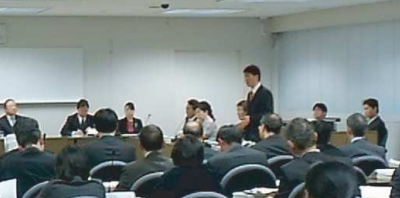
2月29日企画総務委員会 質疑

企画総務委員会:手数料条例の一部改正について 三月二十四日、企画総務委員会に付託された墨田区手数料条例の一部改正について質疑しました。前の定例会企画総務委員会で質疑しましたが、7月から開始されるインボイスカードを使用したレジ等の多機能端末機による住民票の写し等の交付においてレジ手3社の機種が違いますが、予防・置き忘れについて質問し、担当部長答弁は、機種は違いますが地方公共団体情報システム(J-LIS)の画面が出ますのでテストすることです。置き忘れの場合は遺失物として警察に届けることとなります。悪用した場合は罰せられることとなります。コンビニでの届け出について、今後調査してまいります。