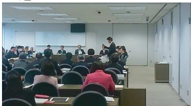
3/28 墨田区基本計画調査特別委員会 質疑

三月二十八日、墨田区基本計画調査特別委員会が開かれ、向う十年間の墨田区基本計画素案・墨田区総合戦略、墨田区人口ビジョンの説明について質疑、十年間の財政負担の大きい施策の一つ、東武スカイツリーライン、曳舟・スカイツリー間の高架化について各年度の特別区債残高350億円以内と大阪府債を活用している基金も含めて区の財政運営について質問しました。